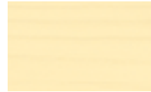
● צהוב רך P5 15