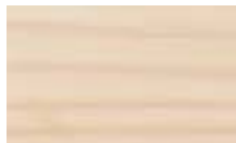
A550 לבן חם ●