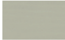
● ירוק מרווה P5 18