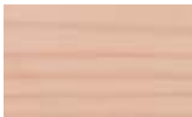
A503 רוד עתיק ●