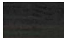
485-041 שחור ▲ A541 שחור ●