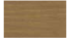
● ירוק חאקי A5 13