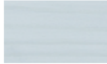
● תכלת P5 17