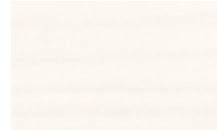
● לבן מלכותי 781-549