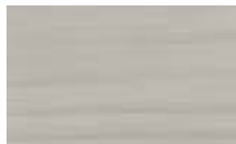
A501 אפור סתוי ●