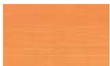
A504 כתום שקיעה ●