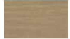
● ירוק ערבה A5 12