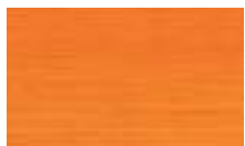
A505 כתום ●