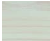
WA 304 תכלת אפרפר