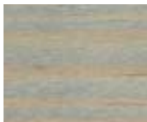
WA 303 אפור כחלחל