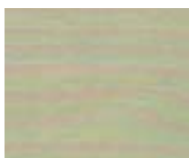
WA 312 פרי הפיסטוק