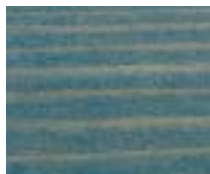
WA 307 כחול ג'ינס