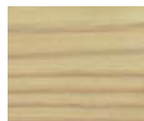
WA 314 ירוק אפרפר