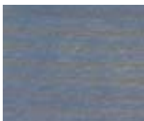
WA 301 כחול מלכותי