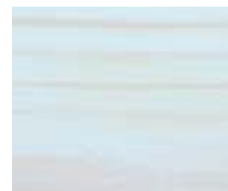
WT 305 תכלת תינוק