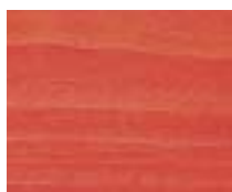
WA 320 אדום לוחט

הערה: הדוגמיות נצבעו על עץ אורן. הגוון הסופי משתנה בשימוש בסוגי עץ שונים.