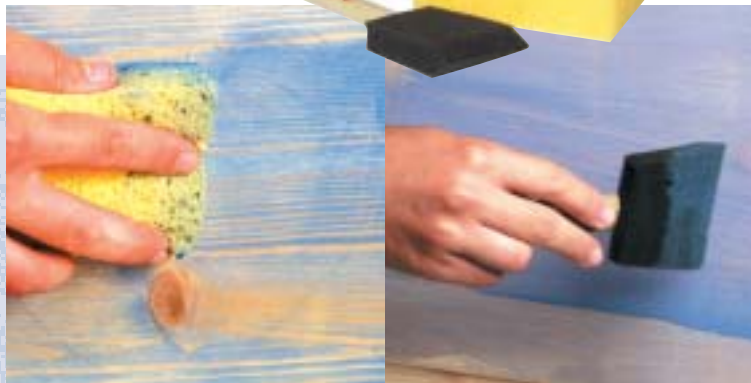
הודו ווש נצבע בעזרת ספוג או מברשת ספוג למקומות קטנים