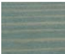
WA 302 כחול נהר