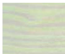
WT 313 ירוק רענן