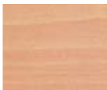
WA 317 ורוד מסטיק