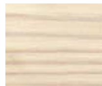
WT 300 לבן שנהב