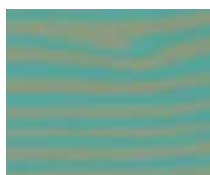
WA 310 טורקיז