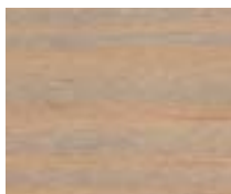
WA 308 פריחת לבנדר