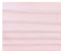
WT 309 סגול עדין