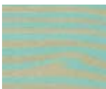
WA 311 תכלת מים